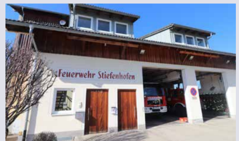
Das Feuerwehrhaus entstand 2006. Nach dem Jubiläumfest beginnen die Arbeiten zur Erweiterung des Gebäudes.