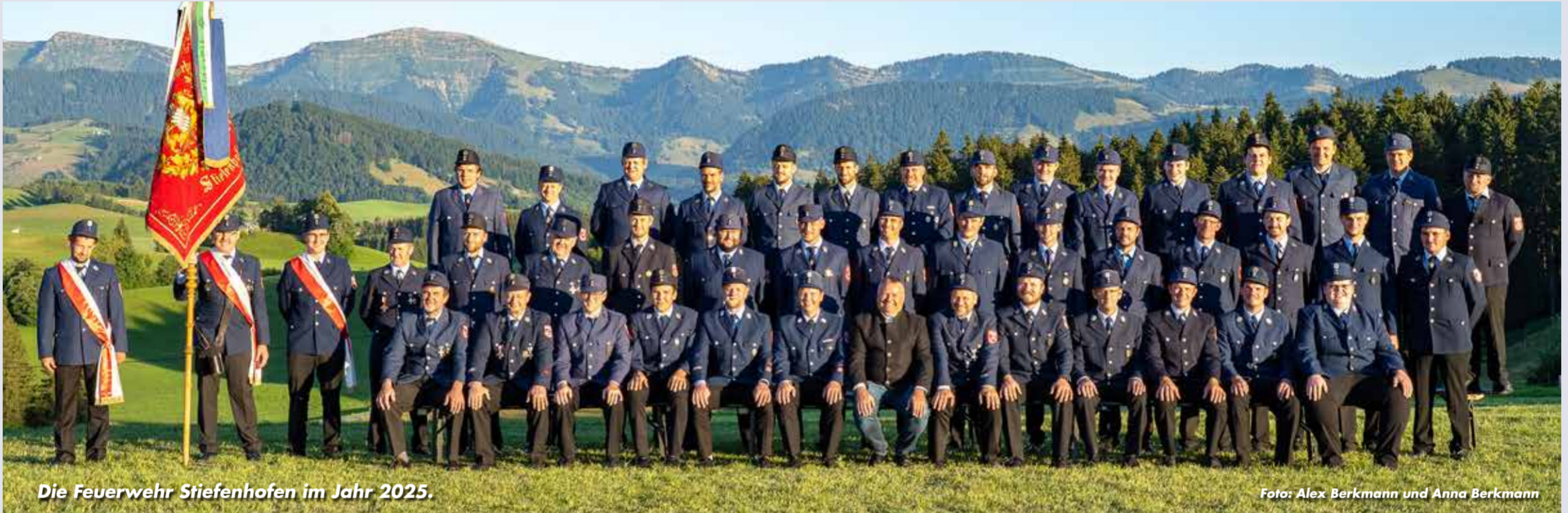
Die Feuerwehr Stiefenhofen im Jahr 2025.